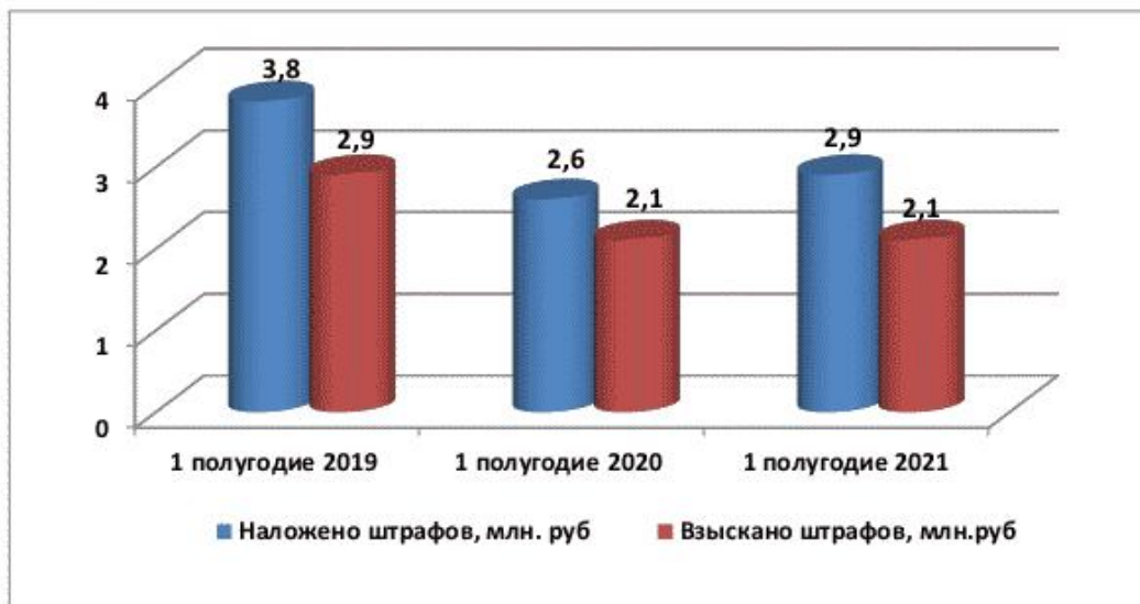
Рис. 3. Штрафы

Взыскано 2,1 млн. руб. (за 1 полугодие 2020 года - 2,1 млн. руб., за 1 полугодие 2019 года - 2,9 млн. руб.), процент взыскиваемости составил - 73% (за 1 полугодие 2020 года - 82%, за 1 полугодие 2019 года - 77%) (см. Рисунок 3).